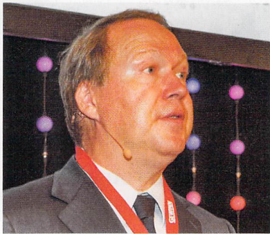
Anlageexperte Max Otte präsentierte wertvolle Anlagetipps und sein neues Buch „Rettet unser Bargeld!“